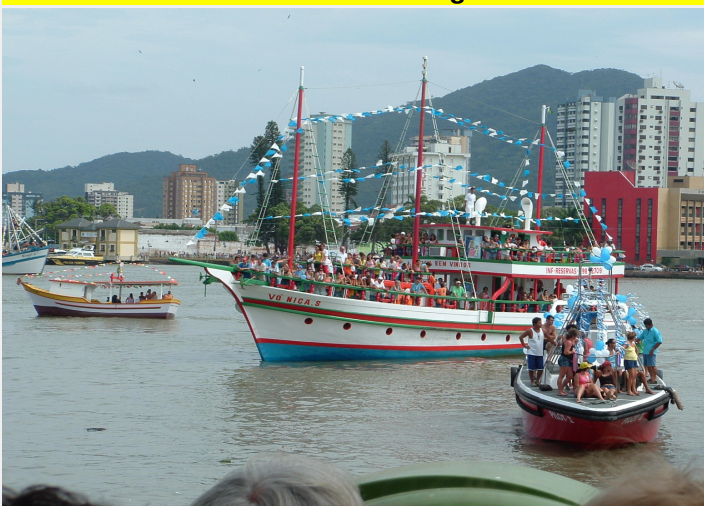
Festa N.Sra. dos Navegantes-Procissão Marítima