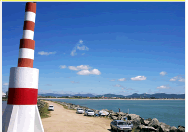
Farol da Barra