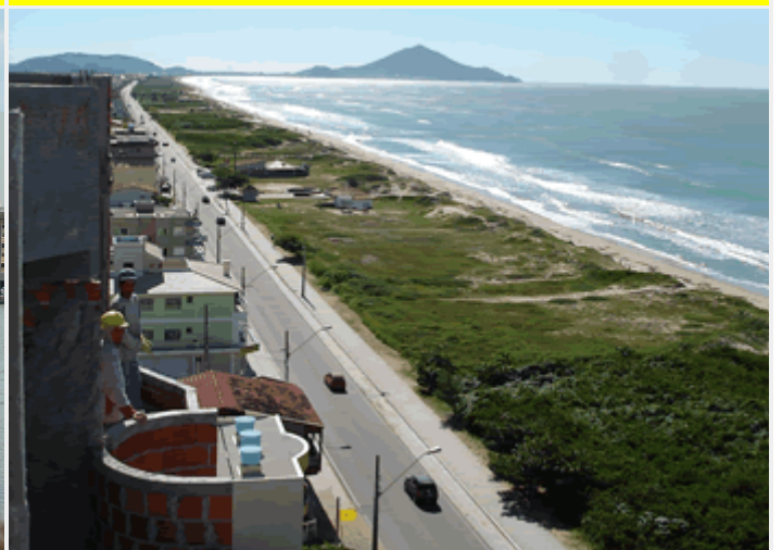
Av. Beira Mar