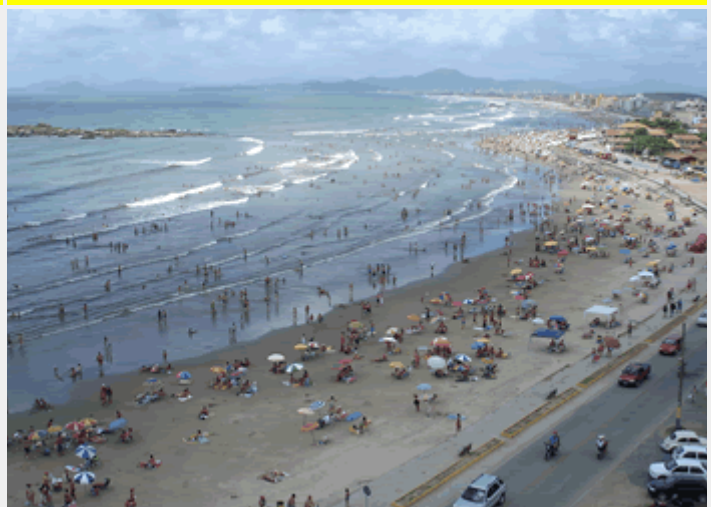
Praia de Gravata