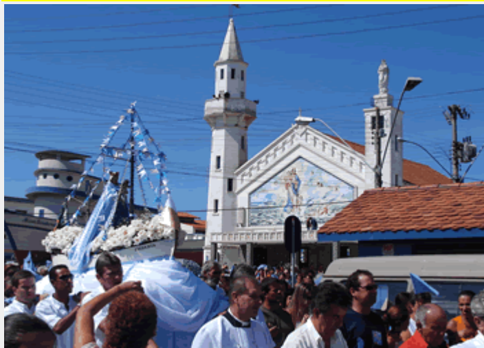
Festa N.Sra.dos Navegantes