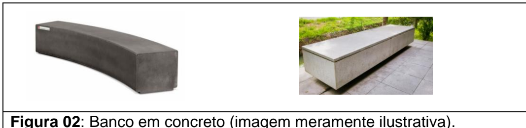
Figura 02: Banco em concreto (imagem meramente ilustrativa).

Serão executados em concreto armado dimensões 40 cm de assento, altura de 45cm e comprimento conforme projeto, com acabamento em concreto aparente, conforme figura 02. Cabe a contratada dimensionar para garantir a armadura mínima necessária.