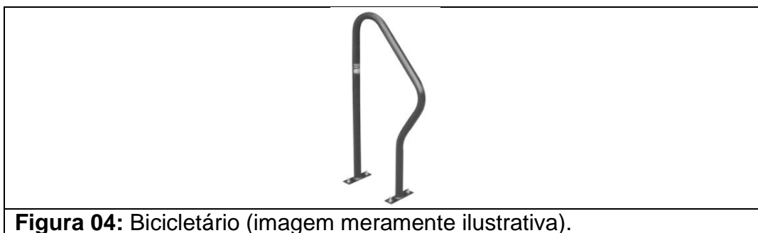
Figura 04: Bicicletário (imagem meramente ilustrativa).

Deverá ser executado por meio de tubos de aço galvanizado a fogo tipo R individual com pintura eletrostática na cor preta e com chumbador galvanizado. Cada peça tem capacidade para apoiar duas bicicletas. (figura 04).